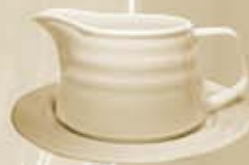
▶ SALSERA + PLATO SAUCEBOAT + SAUCER RBSACP (400 cc. - 18 cm.) RBSA (400 cc.) RBPSPA (18 cm.)