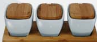
JGO. 3 BOWLS RECT. C/TAPA + BASE DE MADERA 3 RECTANGULAR BOWLS + WOOD TRAY AJ3BTBM (27x10x8 cm.)