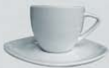
JGO. TAZA Y PLATO TRIANGULO CUP + SAUCER TTP100 (100 cc.) TTP210 (210 cc.)