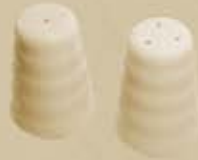
▶ PIMENTERO-SALERO PEPPER SHAKER - SALT SHAKER RBPIM RBSAL