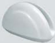
SERVILLETERO NAPKIN HOLDER DSV