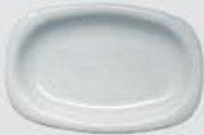
PLATÓN RECTANGULAR RECTANGULAR PLATE DEPR29 (29 cm.) DEPR34 (34 cm.) DEPR39 (39 cm.)