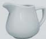
JARRITA CREMERA- LECHERA CREAMER DJC150 (150 cc.) DJL280 (280 cc.)