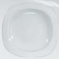
PLATO SOPERO DEEP PLATE DEPSC23 (23 cm.)