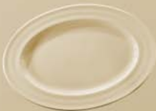
▶ PLATÓN OVALADO OVAL PLATE RBP034 (34 cm.)