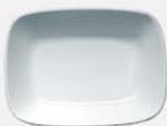
PLATÓN RECTANGULAR HONDO DEEP RECTANGULAR PLATE DEPRH14 (14 cm. - 150 cc.) DEPRH17 (17 cm. - 250 cc.) DEPRH20 (20 cm. - 450 cc.)