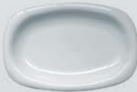
PLATÓN RECTANGULAR RECTANGULAR PLATE DEPR29 (29 cm.) DEPR34 (34 cm.) DEPR39 (39 cm.)