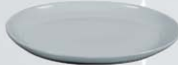
PLATÓN OVALADO OVAL PLATTER APO3727 (37x27 cm.) APO4231 (42x31 cm.)