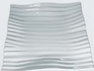
PLATÓN CUADRADO SQUARE PLATE APEOC35 (35x35 cm.) APEOC41 (41x41 cm.)