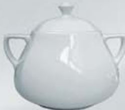
SOPERA CON TAPA SOUP TUREEN + LID DESTC (3.200 cc.)