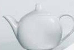
TETERA - CAFETERA ESFERICA JAZZ CON TAPA TEA - COFFEE POT + LID JZTTE380 (380 cc.) JZCTE1100 (1.100 cc.)