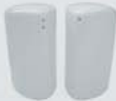
PIMENTERO-SALERO PEPPER SHAKER- SALT SHAKER TPIM TSAL