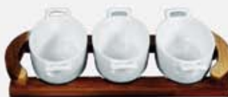
JGO. 3 CAZUELITAS MED. OVALES C/ASAS + BASE DE MADERA 3 OVAL BOWLS + WOOD TRAY AJ3CMOBM (31x14x5 cm.)