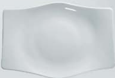
PLATÓN RECTANGULAR FLAT PLATE OPTR36 (36 cm.)