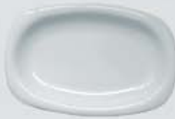
PLATÓN RECTANGULAR RECTANGULAR PLATE DEPR29 (29 cm.) DEPR34 (34 cm.) DEPR39 (39 cm.)