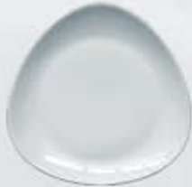
PLATO PASTEL-TRINCHE FLAT PLATE TPP21 (21 cm.) TPT27 (27 cm.) TPT30 (30 cm.)