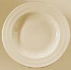
▶ PLATO SOPERO DEEP PLATE RBPS23 (23 cm.)