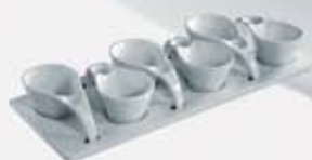
JUEGO DE 6 SALSERAS CON BASE 6 SAUCE BOWLS + TRAY AJ6SB (37x15 cm.)