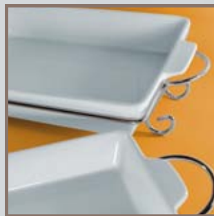
Bandejas y Fuentes