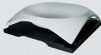
PLATO SOPERO CUADRADO CON BASE SQUARE DEEP PLATE + WOODEN STAND CVPSB20 (20.5x20.5 cm.)