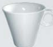
TAZA CAFÉ ALTA XO CUP OTCR210 (210 cc.)