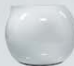
JARRITA LECHERA ESFÉRICA CREAMER JZJL250E (250 cc.)