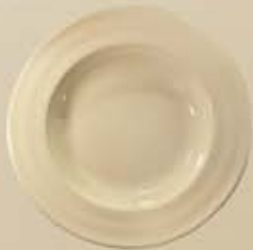
▶ PLATO PASTA DEEP PLATE RBPP30 (30 cm.)