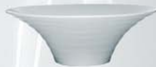
TAZÓN REDONDO BOWL ATRO20 (20 cm. - 350 cc.)