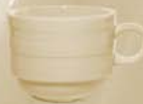
▶ TAZA CAFÉ CUP RBTC90 (90 cc.) RBTC230 (230 cc.)