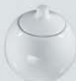
AZUCARERA ESFÉRICA CON TAPA SUGAR BOWL + LID JZATE (250 cc.)