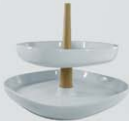
CENTRO MESA 2 NIVELES FRUIT STAND ACEM2 (27X27X20 cm.)