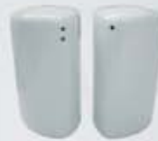
PIMENTERO-SALERO PEPPER SHAKER-SALT SHAKER TPIM TSAL