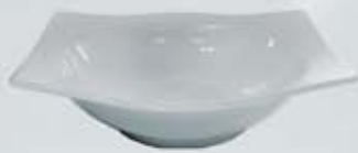
TAZÓN RECTANGULAR SALAD BOWL OTR19 (19 cm.)