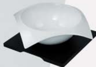
BOWL CUADRADO CON BASE SALAD BOWL + WOODEN STAND CVBB23 (23x23x9 cm.)