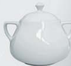
SOPERA CON TAPA SOUP TUREEN + LID DESTC (3.200 cc.)