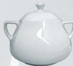
SOPERA CON TAPA SOUP TUREEN + LID DESTC (3.200 cc.)