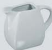
JARRITA LECHERA CUADRADA CREAMER AJLC400 (250 cc.)