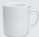
TAZA MUG CUADRADA MUG DEPMC300 (300 cc.)