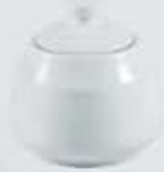
AZUCARERA REDONDA CON TAPA SUGAR BOWL + LID DAT