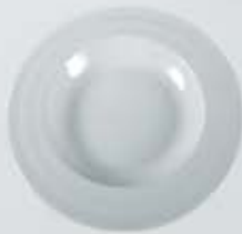
PLATO PASTA DEEP PLATE RPP30 (30 cm.)