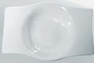
PLATO SOPERO RECTANGULAR DEEP PLATE OPSR26 (26 cm.)