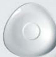
PLATO TRIÁNGULO PARA TAZA SAUCER TPT100 (100 cc.) TPT210 (210 cc.)