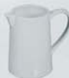
JARRITA LECHERA RECTA CREAMER- MILK POT AJLR100 (90 cc.) AJLR500 (400 cc.) AJLR1100 (700 cc.)