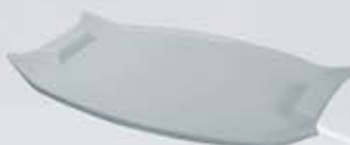
BANDEJA SERVIR OVALADA CON ASAS OVAL TRAY WITH HANDLES ABSOA4628 (46x28 cm.)