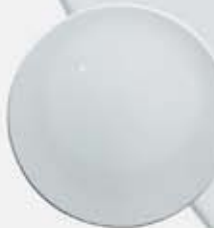
PLATO TRINCHE- BASE FLAT PLATE OSPT28 (28 cm.) OSPT32 (32 cm.)