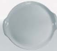
PLATÓN PASTELERO RED. CON ASAS CAKE PLATE WITH HANDLES APPA32 (32 cm.) APPA36 (36 cm.) APPA37 (37 cm.)