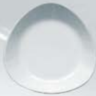
PLATO SOPERO DEEP PLATE TPS22 (22 cm.)