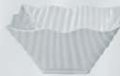
BOWL CUADRADO SALAD BOWL ABOC15 (15x15x8 cm. - 450 cc.)