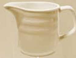
▶ JARRITA CREMERA CREAMER RBJC150 (150 cc.)