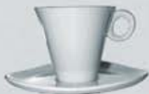
JGO. TAZA ALTA XO Y PLATO TRIÁNGULO CUP + SAUCER TTAP210 (210 cc.)