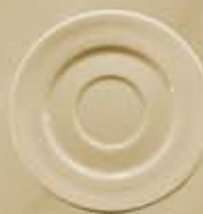
▶ PLATO PARA TAZA SAUCER RBPT90 (90 cc.) RBPT0230 (230 cc.)