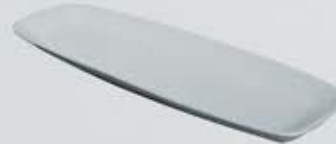
PLATÓN OVALADO OVAL PLATTER APO6121 (61x21 cm.)