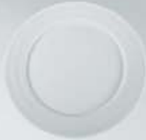
PLATO PAN-PASTEL- TRINCHE-BASE FLAT PLATE RPT16 (16 cm.) RPT20 (20 cm.) RPT24 (24 cm.) RPT27 (27 cm.) RPB32 (32 cm.)