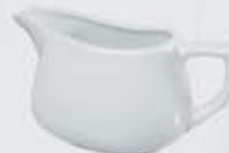
SALSERA CON ASA SAUCEBOAT DSA (400 cc.)