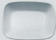
PLATÓN RECTANGULAR HONDO DEEP RECT. PLATE DEPRH14 (14 cm. - 150 cc.) DEPRH17 (17 cm. - 250 cc.) DEPRH20 (20 cm. - 450 cc.)