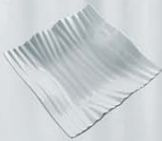
PLATO HONDO CUADRADO SQUARE DEEP PLATE APHOC20 (20.5x20.5 cm.)