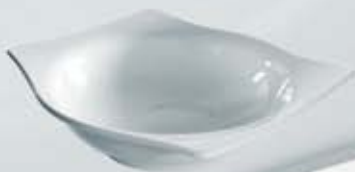
ENSALADERA RECTANGULAR SALAD BOWL OER28 (28 cm.)