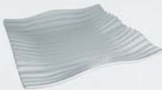
PLATITO PARA TAPAS- PLATO CUADRADO SQUARE PLATE APTOC8 (8x8 cm.) APPOC10 (10x10 cm.) APPOC15 (15x15 cm.) APPOC20 (20x20 cm.) APEOC25 (25x25 cm.) APEOC30 (30x30 cm.)