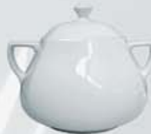
SOPERA CON TAPA SOUP TUREEN + LID DESTC (3.200 cc.)