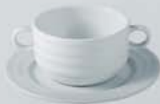
JGO. TAZÓN CONSOMÉ CON OREJAS Y PLATO CONSOUMÉ BOWL + SAUCER RTCOP (350 cc. - 18 cm.) RTC012 (350 cc.) RPTC (18 cm.)