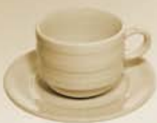
▶ JGO. TAZA Y PLATO CUP + SAUCER RBTP90 (90 cc.) RBTP230 (230 cc.)