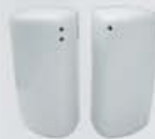
PIMENTERO-SALERO PEPPER SHAKER - SALT SHAKER TPIM TSAL