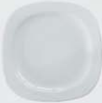
PLATO PAN-PASTEL- TRINCHE-BASE FLAT PLATE DEPTC16 (16 cm.) DEPTC18 (18 cm.) DEPTC21 (21 cm.) DEPTC27 (27 cm.) DEPTC29 (29 cm.) DEPTC32 (32 cm.)