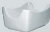
AZUCARERA SOBRES RECTANGULAR RECTANGULAR SUGAR BOWL AASR (11x7.5 cm.)