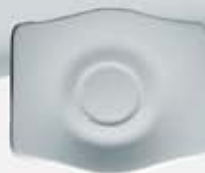
PLATO RECTANGULAR PARA TAZA SAUCER OPTR210 (15.5 cm.)