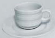
JGO. TAZA Y PLATO CUP + SAUCER RTP90 (90 cc.) RTP230 (230 cc.)