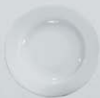
PLATO SOPERO DEEP PLATE DPS22 (22 cm.) DPS23 (23 cm.)