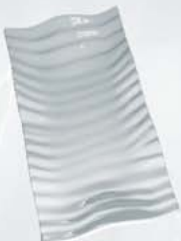
PLATÓN RECTANGULAR RECTANGULAR PLATE APRO139 (13x9 cm.) APRO2013 (20x13 cm.) APRO3020 (30x20 cm.) APRO3215 (32x15 cm.) APRO4125 (41x25 cm.)