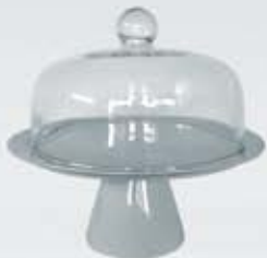
PASTELERA CON BASE Y CAMPANA DE VIDRIO CAKE STAND WITH GLASS COVER APABCV36 (36 cm.)