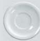
PLATO PARA TAZA RECTA SAUCER DPTR0090 (90 cc.) DPTR170 (170 cc.) DPTR230 (230 cc.)