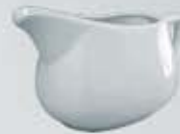
SALSERA CON ASA SAUCEBOAT DSA (400 cc.)