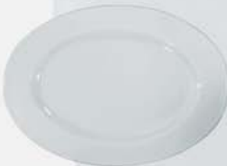
PLATÓN OVALADO OVAL PLATE DPO29 (29 cm.) DPO34 (34 cm.) DPO39 (39 cm.)