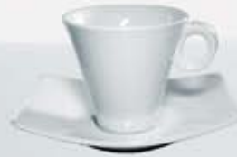
JGO. TAZA ALTA XO Y PLATO CUP + SAUCER OTPR210 (210 cc.)