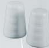
PIMENTERO-SALERO PEPPER SHAKER - SALT SHAKER RPIM RSAL