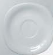
PLATO PARA TAZA CAFÉ CUADRADA SAUCER CPPT90 (90 cc.) CPPT170 (170 cc.) CPPT230 (230 cc.)