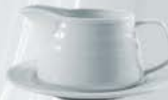
SALSERA + PLATO SAUCEBOAT + SAUCER RSACP (400 cc. - 18 cm.) RSA (400 cc.) RPSA (18 cm.)