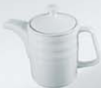
CAFETERA CON TAPA COFFEE POT + LID RCT (750 cc.)