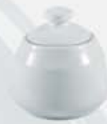
AZUCARERA REDONDA CON TAPA SUGAR BOWL + LID DAT