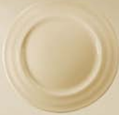
▶ PLATO PAN-PASTEL-TRINCHE-BASE FLAT PLATE RBPT16 (16 cm.) RBPT20 (20 cm.) RBPT24 (24 cm.) RBPT27 (27 cm.) RBPB32 (32 cm.)