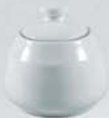
AZUCARERA REDONDA CON TAPA SUGAR BOWL + LID DAT