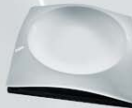
PLATO CUADRADO CON BASE SQUARE PLATE + WOODEN STAND CVPTB21 (21x21 cm.) CVPTB26 (26x26 cm.) CVPTB30 (30x30 cm.)