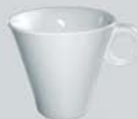
TAZA CAFÉ ALTA XO CUP OTCR210 (210 cc.)