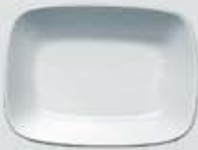
PLATÓN RECTANGULAR HONDO DEEP RECTANGULAR PLATE DEPRH14 (14 cm. - 150 cc.) DEPRH17 (17 cm. - 250 cc.) DEPRH20 (20 cm. - 450 cc.)