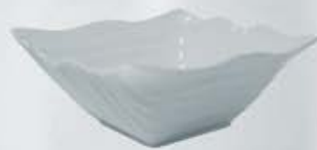
ENSALADERA CUADRADA SALAD BOWL AEOC21 (21x21x9 cm. - 1.000 cc.)