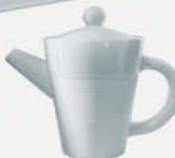
CAFETERA CONICA ANILLADA CON TAPA COFFEE POT + LID ACCAT1000 (600 cc.)