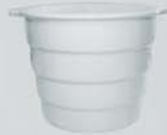
ENFRIADERA - CHAMPAÑERA WINE COOLER BUCKET RECH (20x16 cm.)