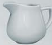
JARRITA CREMERA-LECHERA CREAMER DJC150 (150 cc.) DJL280 (280 cc.)