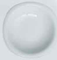
PLATO SOPERO DEEP PLATE CPPS22 (22 cm.)