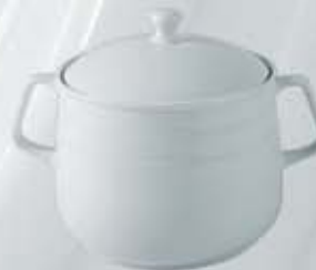
SOPERA CON TAPA SOUP TUREEN + LID RSTC (3.200 cc.)