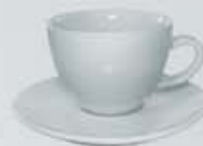
JGO. TAZA Y PLATO BISTRO CUP + SAUCER DTPB400 (400 cc.)