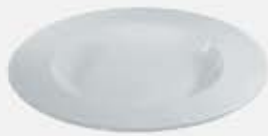
PLATO PASTA DEEP PLATE DPP30 (30 cm.)