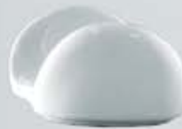
SERVILLETERO INVERTIDO NAPKIN HOLDER DSVI