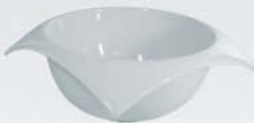
BOWL CUADRADO CURVÉ SALAD BOWL CVB15 (15x15x7 cm. - 400 cc.) CVB17 (17x17x8 cm. - 800 cc.) CVB20 (20x20x8.5 cm. - 1.000 cc.) CVB23 (23x23x9 cm. - 1.200 cc.)