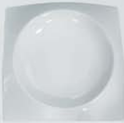
PLATITO PARA TAPAS- PLATO CUADRADO SQUARE PLATE CVPPT (8x8 cm.) CVPT10 (10x10 cm.) CVPT15 (15x15 cm.) CVPT18 (18x18 cm.) CVPT21 (21x21 cm.) CVPT26 (26x26 cm.) CVPT30 (30x30 cm.)