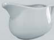
SALSERA CON ASA SAUCEBOAT DSA (400 cc.)