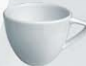
TAZA CAFÉ CUP TTC100 (100 cc.) TTC210 (210 cc.)