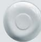
PLATO PARA TAZA SAUCER DPT0060 (60 cc.) DPT0090 (90 cc.) DPT0140 (140 cc.) DPT0170 (170/230 cc.)