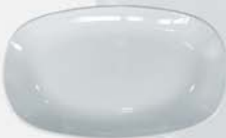
PLATÓN OVALADO SEMIHONDO DEEP OVAL PLATE DPOH39 (39 cm.)