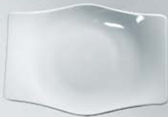
PLATO TRINCHE RECTANGULAR FLAT PLATE OPTR23 (23 cm.) OPTR27 (27 cm.) OPTR32 (32 cm.)