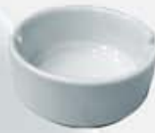
CENICERO ASHTRAY DCE (8.5 cm.)