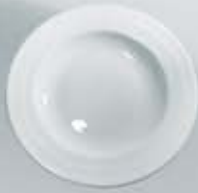
PLATO SOPERO DEEP PLATE RPS23 (23 cm.)