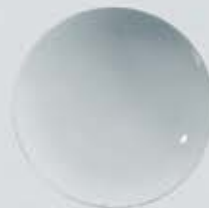
PLATO PASTA O ENSALADERA SALAD BOWL OSPE26 (26 cm.)