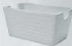
AZUCARERA SOBRES RECTANGULAR RECT. SUGAR BOWL AASRO (12.5x7 cm.)