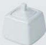
AZUCARERA CUADRADA CON TAPA SQUARE SUGAR BOWL + LID AACT (9x9 cm.)