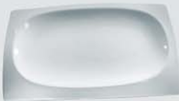
PLATÓN RECTANGULAR RECTANGULAR PLATE CVPR168 (16x8 cm.) CVPR2010 (20x10 cm.) CVPR2515 (25x15 cm.) CVPR3117 (31x17.5 cm.) CVPR3621 (36x21 cm.) CVPR4425 (44x25 cm.)