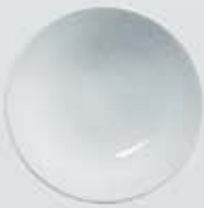
PLATO SOPERO DEEP PLATE OSPS23 (23 cm.)