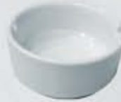
CENICERO ASHTRAY DCE