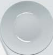
PLATO PAN-PASTEL- TRINCHE FLAT PLATE OSPP17 (17 cm.) OSPP20 (20 cm.) OSPT25 (25 cm.)