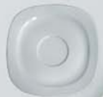
PLATO PARA TAZA CAFÉ CUADRADA SAUCER DEPC90 (90 cc.) DEPC170 (170/230 cc.)