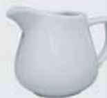
JARRITA CREMERA-LECHERA CREAMER DJC150 (150 cc.) DJL280 (280 cc.)