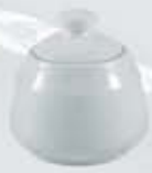
AZUCARERA REDONDA CON TAPA SUGAR BOWL + LID DAT