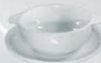
JGO. TAZÓN CONSOMÉ CON ASAS Y PLATO CONSOMMÉ BOWL + SAUCER DTCP12 (350 cc. - 17 cm.) DTCA (12 cm. - 350 cc.) DPTC (17 cm.)