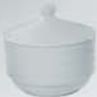
AZUCARERA CON TAPA SUGAR BOWL + LID RAT (11 cm.)