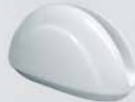
SERVILLETERO NAPKIN HOLDER DSV