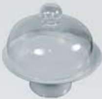
PASTELERA CON BASE Y CAMPANA DE VIDRIO CAKE STAND WITH GLASS COVER APABCV24 (24 cm.)