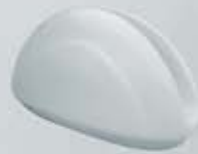
SERVILLETERO NAPKIN HOLDER DSV