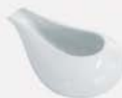
CREMERA CON PICO SIN ASA CREAMER ACP11 (11x8 cm. - 100 cc.) ACP13 (13x9 cm. - 200 cc.)