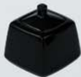
AZUCARERA CUADRADA NEGRA CON TAPA SQUARE SUGAR BOWL + LID AACNT (9x9 cm.)