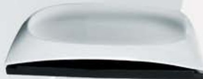
PLATÓN RECTANGULAR CON BASE RECTANGULAR PLATE + WOODEN STAND CVPRB3117 (31x17.5 cm.) CVPRB3621 (36x21 cm.) CVPRB4425 (44x25 cm.)