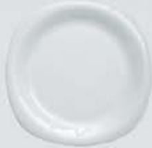
PLATO PASTEL-TRINCHE FLAT PLATE CPPT18 (18 cm.) CPPT20 (20 cm.) CPPT25 (25 cm.) CPPT27 (27 cm.) CPPT30 (30 cm.)