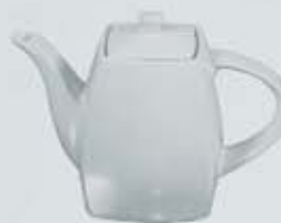
CAFETERA CUADRADA CON TAPA COFFEE POT + LID ACCT1200 (1.100 cc.)