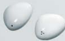
PIMENTERO - SALERO PIEDRA PEPPER SHAKER- SALT SHAKER OPIM OSAL