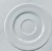
PLATO PARA TAZA SAUCER RPT90 (90 cc.) RPT0230 (230 cc.)