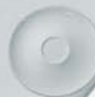
PLATO PARA TAZA BISTRO SAUCER DPTB70 (70 cc.) DPTB230 (185/230 cc.) DPTB400 (400 cc.)