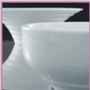
Tazones y Bowls