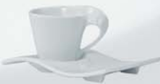
JGO. TAZA Y PLATO CUP + SAUCER CVTP90 (90 cc.) CVTP200 (200 cc.) CVTP250 (250 cc.)