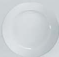
PLATO PAN-PASTEL- TRINCHE-BASE FLAT PLATE DPT16 (16 cm.) DPT20 (20 cm.) DPT24 (24 cm.) DPT26 (26 cm.) DPT27 (27 cm.) DPT32 (32 cm.)