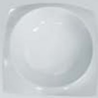
PLATO SOPERO CUADRADO SQUARE DEEP PLATE CVPS20 (20.5 x 20.5 cm.)