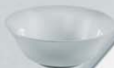
ENSALADERA SALAD BOWL DPV27 (27 cm.)