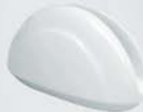
SERVILLETERO NAPKIN HOLDER DSV