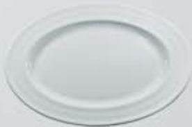
PLATÓN OVALADO OVAL PLATE RPO34 (34 cm.)