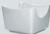
AZUCARERA SOBRES CUADRADA SQUARE SUGAR BOWL AASC (7.5x7.5 cm.)