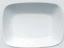
PLATÓN RECTANGULAR HONDO DEEP RECTANGULAR PLATE DEPRH14 (14 cm. - 150 cc.) DEPRH17 (17 cm. - 250 cc.) DEPRH20 (20 cm. - 450 cc.)