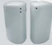
PIMENTERO-SALERO PEPPER SHAKER-SALT SHAKER TPIM TSAL